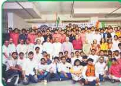
विद्यार्थीगृहना छात्रो साथे महानुभावो