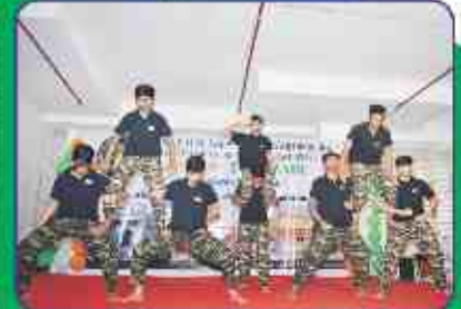
विद्यार्थीओ द्वारा पिरामीड नृत्य