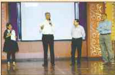
Question & Answer Session