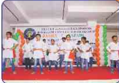
शाळांना विद्यार्थीओनु देशभक्ति नृत्य