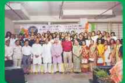
कन्या छात्रालय टीम साथे महानुभावो