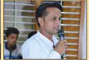
રાત્રી ભાવના અને સંચાલન