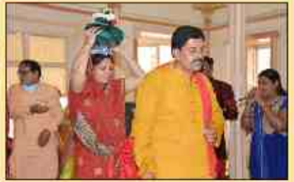
શ્રી સિદ્ધચક્ર પુજન