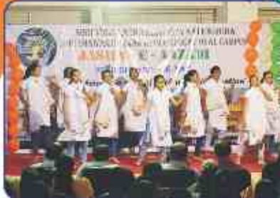
कन्या छात्रालय द्वारा देशभक्ति नृत्य