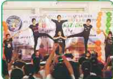
कन्या छात्रालय द्वारा पिरामीड नृत्य